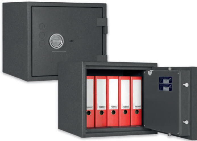
PAPER STAR Light 3 Graphitgrau • graphite grey Dekoration nicht im Lieferumfang enthalten • decoration not included in the delivery

Dokumententresor, LFS30P (EN 15659) / Sicherheitsstufe S2 (EN 14450) Fire protection safe, LFS30P (EN 15659) / Security level S2 (EN 14450)