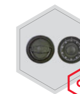
Mechanisches Kombinationsschloss (Ausser Art. 33200- 33201)

Optionale Verschlussvarianten gegen Mehrpreis