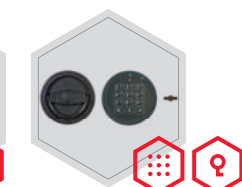
Elektronischschloss kombiniert mit mechanischer Revision (Ausser Art. 33200-33201)