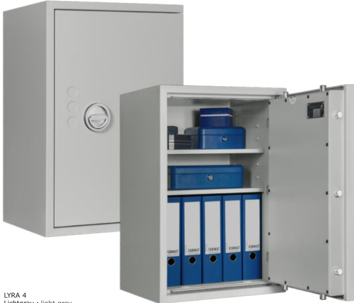
LYRA 4 Lichtgrau • light grey Dekoration nicht im Lieferumfang enthalten • decoration not included in the delivery

Wertschutzschrank, Grad 0 (EN 1143-1) oder Grad I (EN 1143-1) Safe, Grade 0 (EN 1143-1) or Grade I (EN 1143-1)