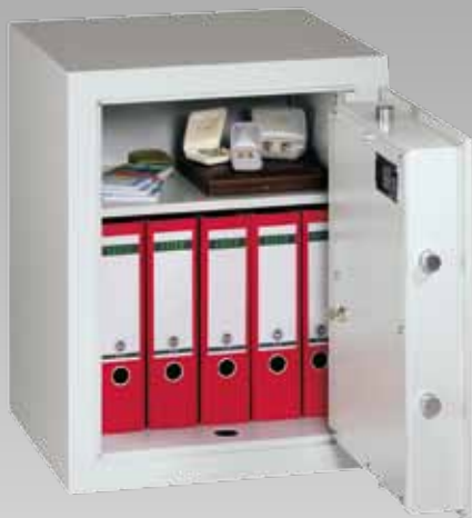
Abb.: MVO 6