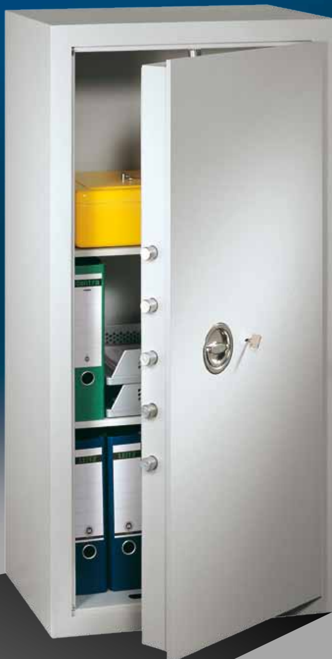
Abb.: MVO 12