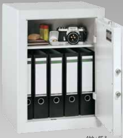
Abb.: PT 3