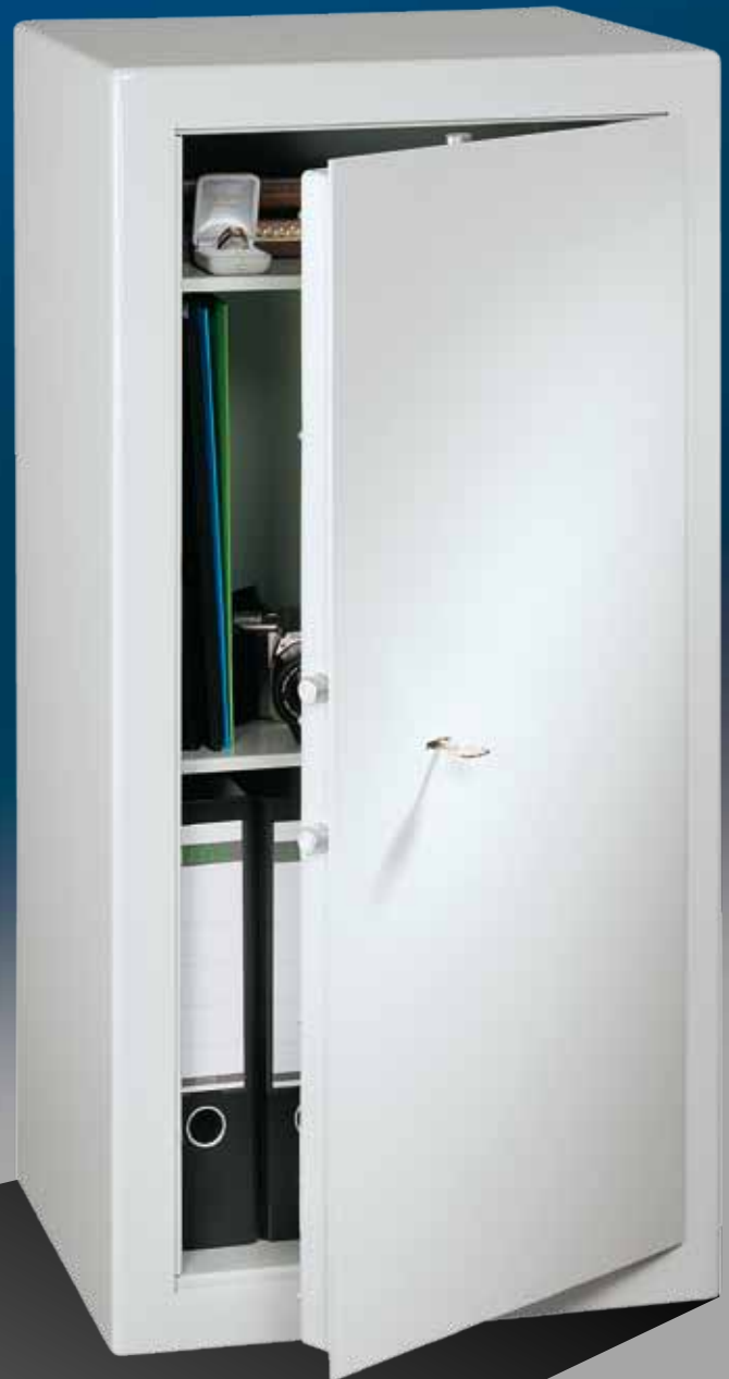
Abb.: PT 9