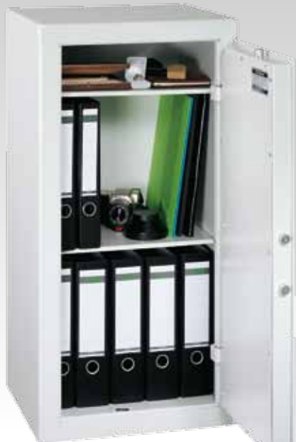
Abb.: PT 9