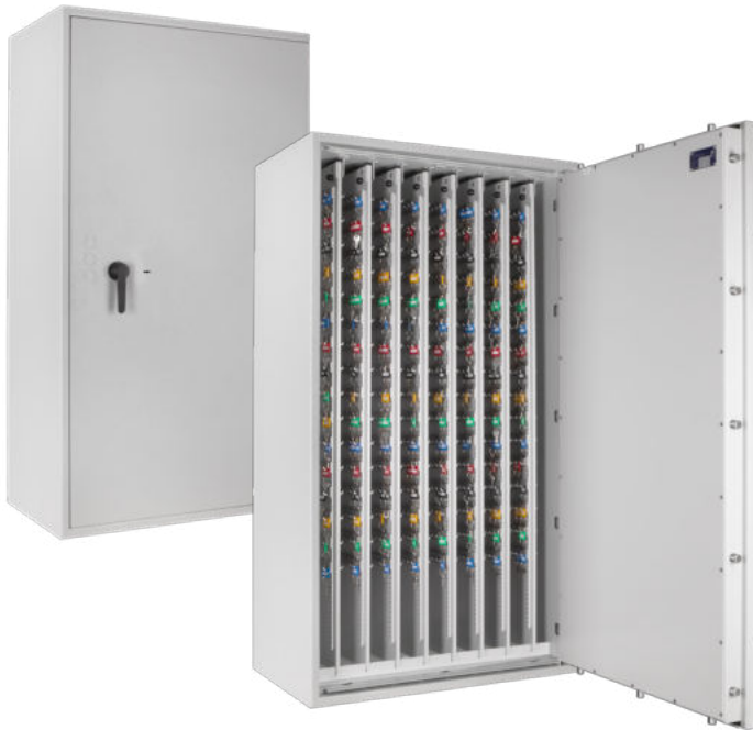
STL 2560 Lichtgrau • light grey Dekoration nicht im Lieferumfang enthalten • decoration not included in the delivery

Schlüsseltresor und Wertschutzschrank, Grad 0 (EN 1143-1) oder Grad I (EN 1143-1) Key safe and security safe, Grade 0 (EN 1143-1) or Grade I (EN 1143-1)