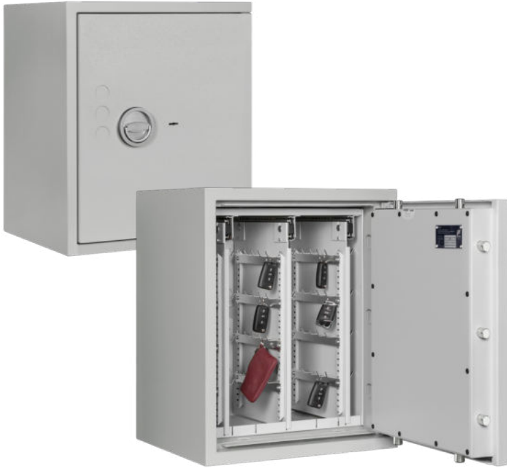
STL AS 144 Lichtgrau • light grey Dekoration nicht im Lieferumfang enthalten • decoration not included in the delivery

Schlüsseltresor und Wertschutzschrank, Grad 0 (EN 1143-1) oder Grad I (EN 1143-1) Key safe and security safe, Grade 0 (EN 1143-1) or Grade I (EN 1143-1)