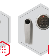
Elektronischschloss kombiniert mit mechanischer Revision