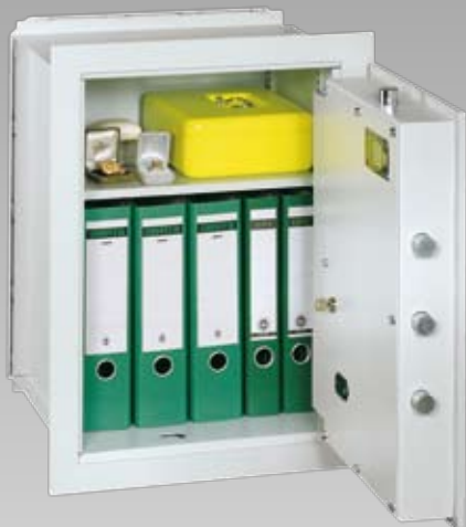
Abb.: VCO 6