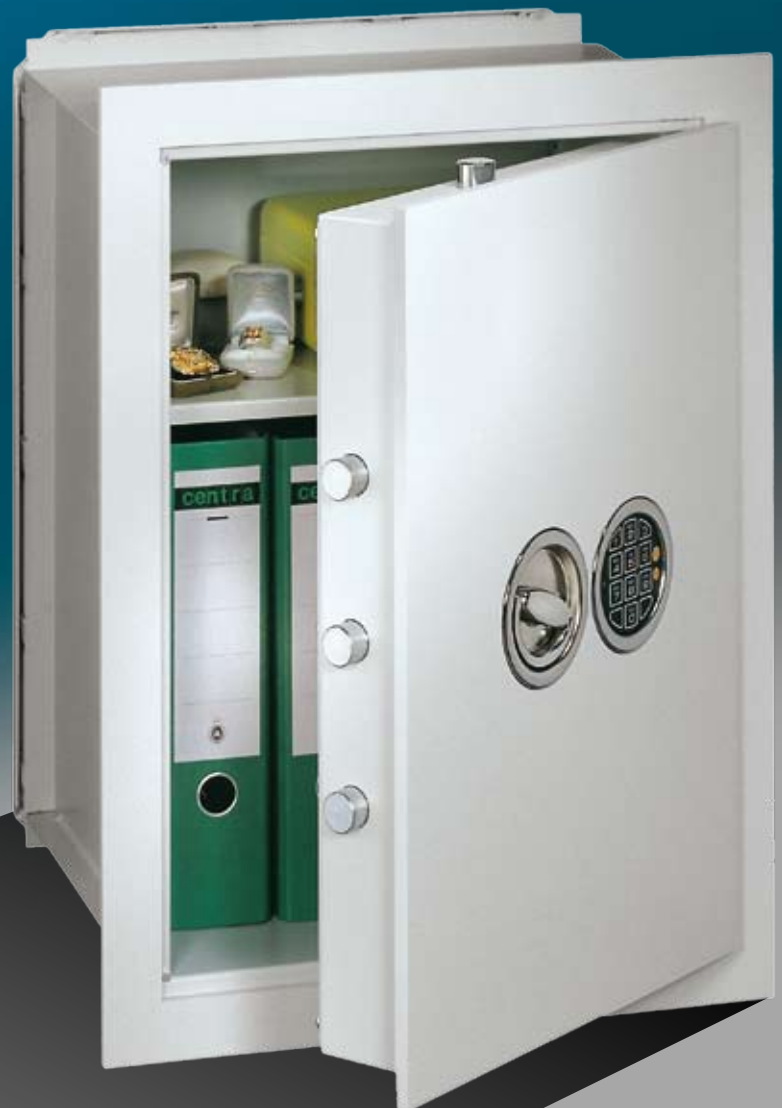
Abb.: VCO 6 (mit Sonderausstattung EZ LG Basic versenkt)