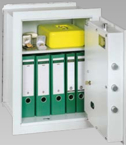
Abb.: VNO 6