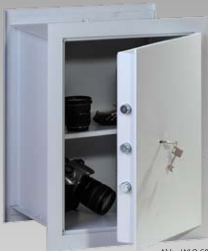
Abb.: WLO 60