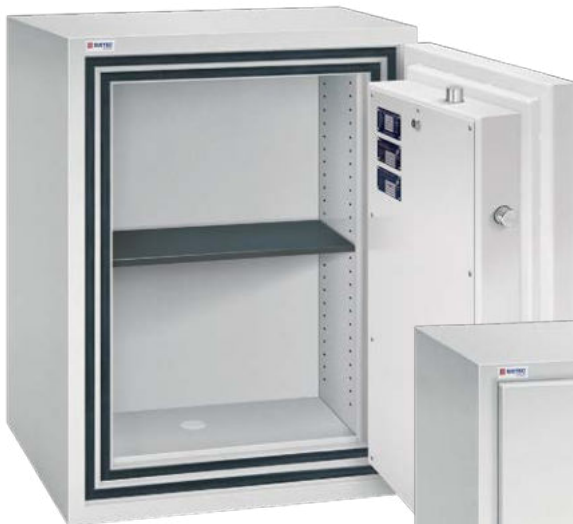
SE 3 LFS - 86/0