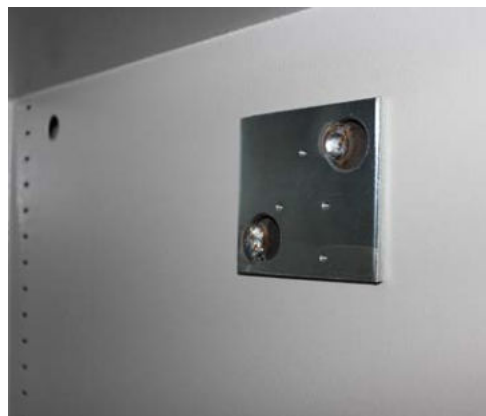
Vorbereitung für eine Alarmkomplettausstattung (Sonderausstattung)