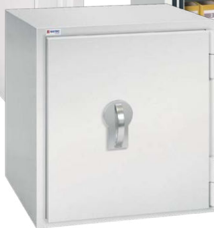
SE 3 LFS - 69/0