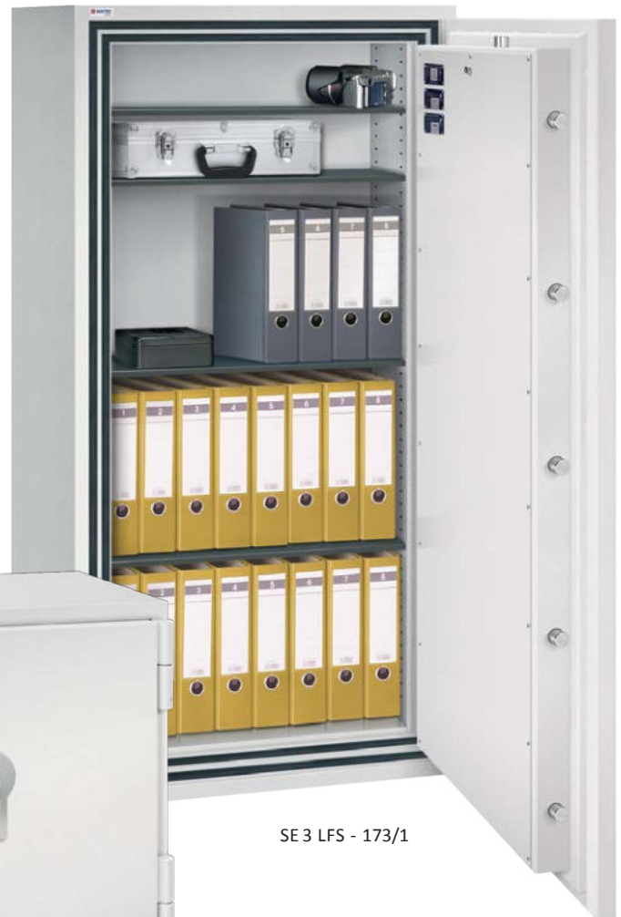
SE 3 LFS - 173/1