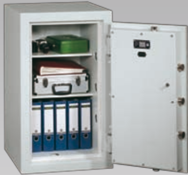
Abb.: EN 1-100