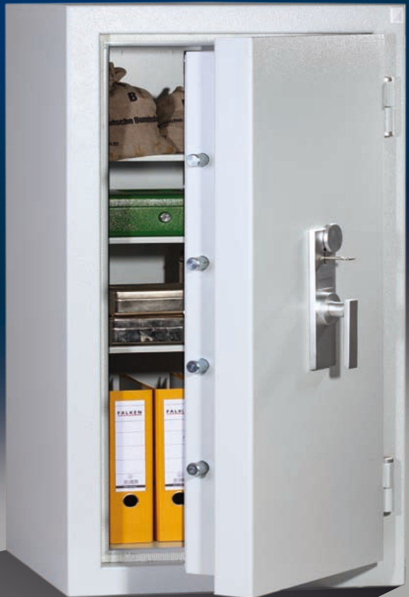
Abb.: EN 3-120