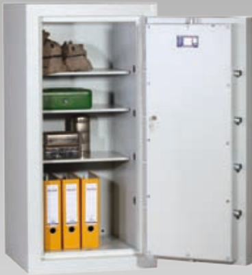
Abb.: EN 3-120