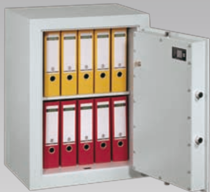
Abb.: EV 1-80