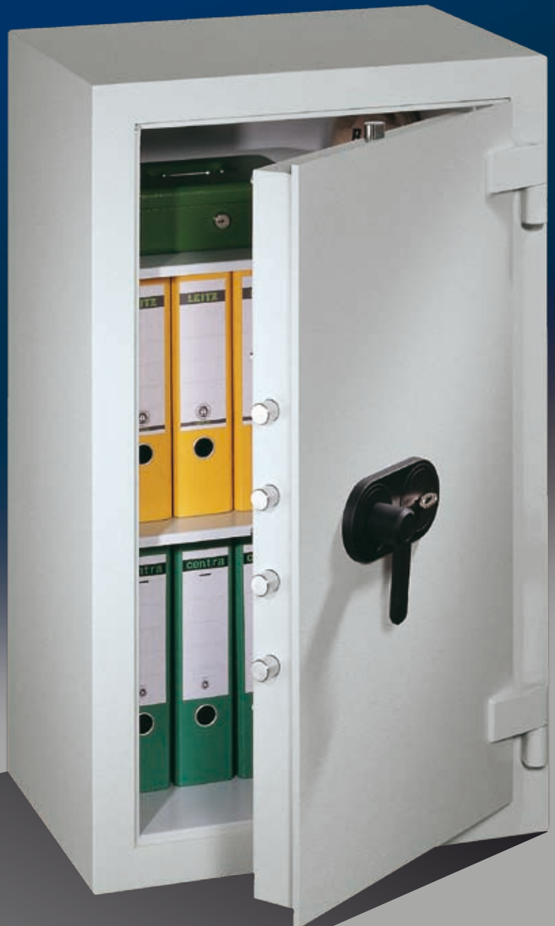
Abb.: EV 1-100

Fachböden ordnertief; vierseitige Bolzenverriegelung