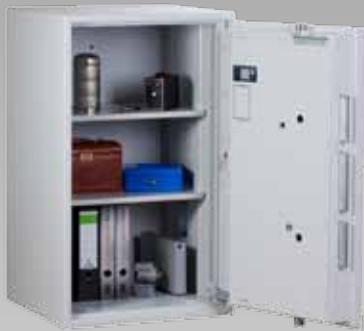
Abb.: EW 2-105