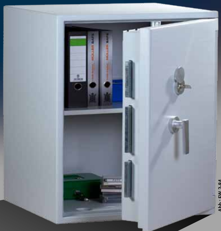
Abb.: EW 2-84