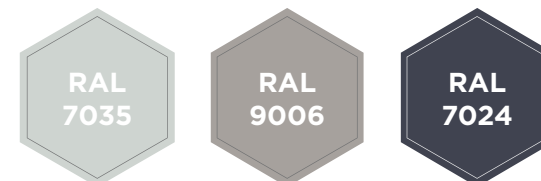
EMA - Komponenten

! Gewichts-, Farb- und Maßangaben sind unverbindlich. Irrtum, Gewichts-, Maß- und Farbveränderungen vorbehalten. Geringe Gewichts-, Farb- und Maßabweichungen sind produktionsbedingt. Technische Änderungen vorbehalten. Tresore evtl. kopplastig, bei Inbetriebnahme entsprechende Sorgfalt gem. Einbauanleitung walten lassen. Piktogramme stehen Symbolisch für die jeweiligen Merkmale.