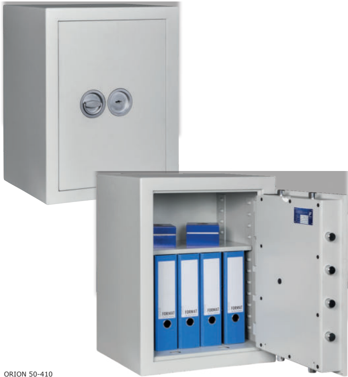
ORION 50-410 Lichtgrau • Light grey Dekoration nicht im Lieferumfang enthalten • decoration not included in the delivery

Wertschutzschrank, Grad I (EN 1143-1) Safe, Grade I (EN 1143-1)