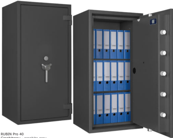
RUBIN Pro 40 Graphitgrau • graphite grey Dekoration nicht im Lieferumfang enthalten • decoration not included in the delivery