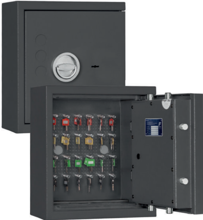
STL 24 Graphitgrau • graphite grey Dekoration nicht im Lieferumfang enthalten • decoration not included in the delivery

Schlüssel-/Wertschutzschrank, Grad 0 (EN 1143-1) Key-/safe, Grade 0 (EN 1143-1)