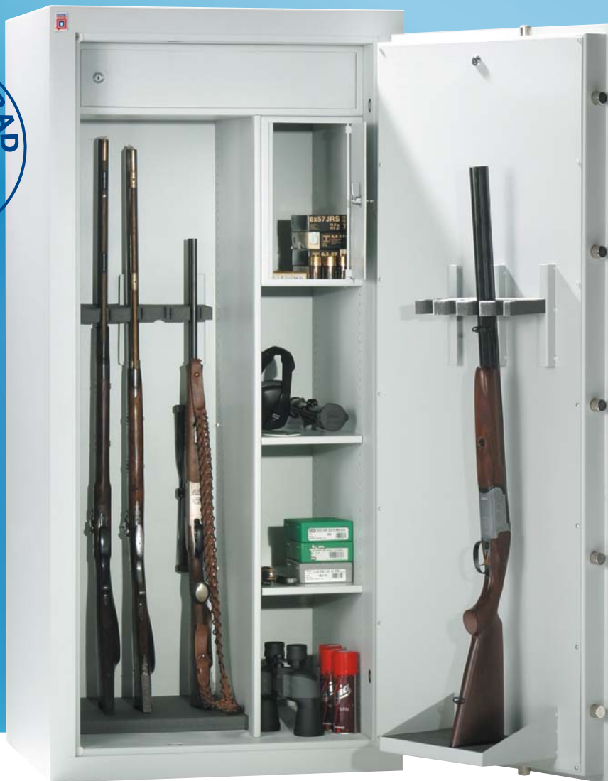
WSN 160 / 3